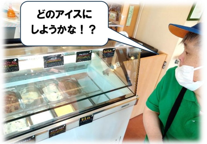
どのアイスにしようかな！？