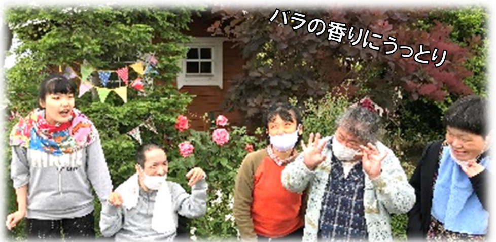
バラの香りにうっとり