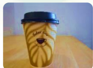
ホットコーヒー 250円