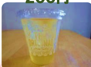
アップルジュース 200円

10月から飲み物のテイクアウトを始めました！ テイクアウト日のみの販売になります。ぜひ、お立ち寄りください！