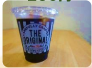
アイスコーヒー 250円