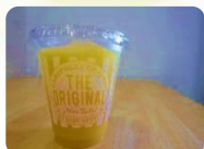
オレンジジュース 200円