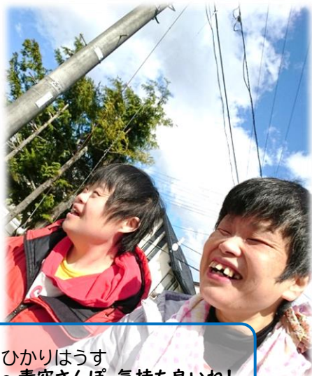
ひかりはうす ～青空さんぽ、気持ち良いね!