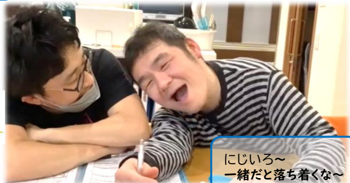
にじいろ～ ～一緒だと落ち着くな～