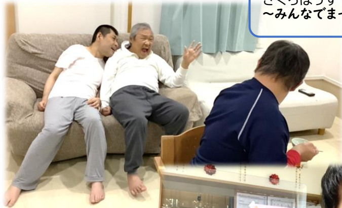
さくらはうす ～みんなでまったりタイム