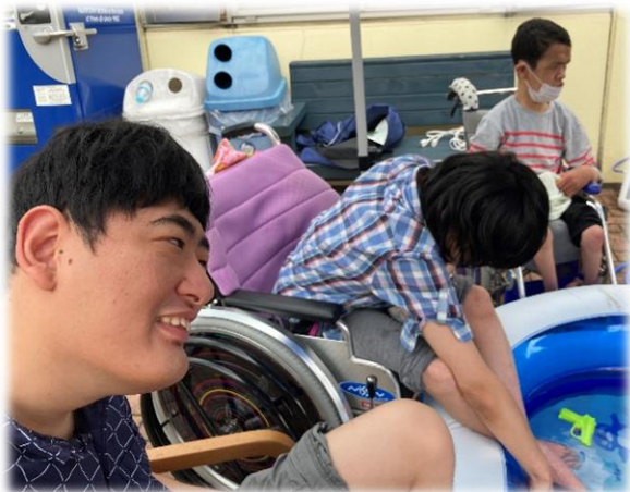
夏の暑い日は、外でも室内でも水遊び♪