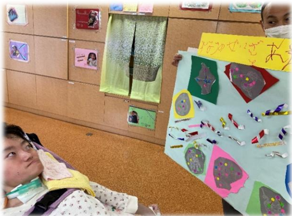
夏のアート活動で天の川と花火を作りました！

まだまだ新型コロナウイルスの感染が収束しない状況ではありますが、アプリでは日々の感染症対策を行ないながら日中活動を展開しています。今回は、実際にアプリで行なっている活動の一部を紹介したいと思います！