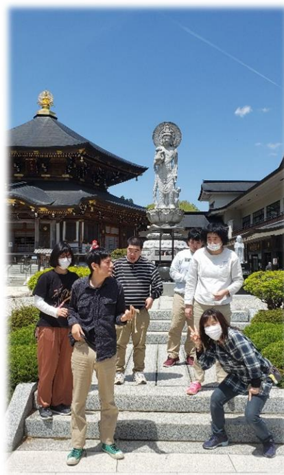
外出日和はみんなで定義山へ！