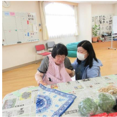
エフロンを着けて準備万端