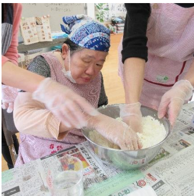
粉にしっかり水をいきわたらせ、