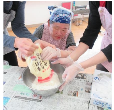
早速、作っていきましょう！