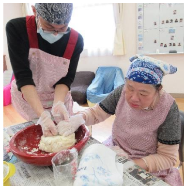
力を合わせ、手と足を使い生地をまとめていきます！