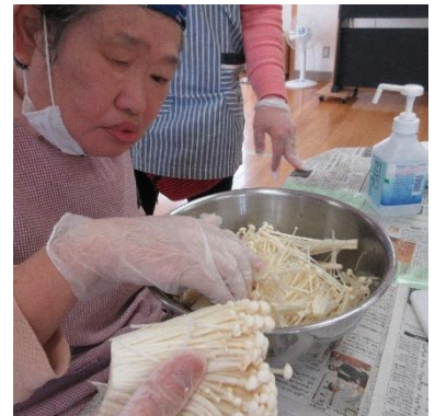
生地を寝かせている間に、具材のしめじとえのきを食べやすくほくしていきましょう！