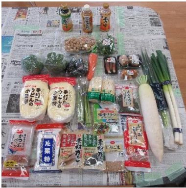
たくさん材料達です！