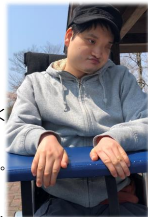
( 記：菊地 )

今、ミントでは、『キラキラしよう』が、合言葉となり、利用者、職員一人ひとりがキラキラ輝く時間をみんなで、作っています。ないものはみんなの力で作ってしまおう！！そんな発想の転換でアートやゲーム作り、紙芝居作りやダンス、そして作業などたくさんのチャレンジをしています。また、これから多くの出会いを求めて、積極的に地域へ出ることで、地域の方々との交流ができればと思っています。利用者のたくさんの笑顔と共に地域へ向けて発信し、一人ひとりが地域の中で、役割を見つけていきたいと思っています。