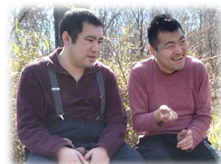
( 記：押切 )

以上の2点です！しかし、頑張るには安心できる場所が必要です。これまで取り組んできた安心できる・心地よい環境を維持、時には更に良くできるように改善しながら、アグレッシブに活動していきます。今年度もよろしくお願ひ致します！