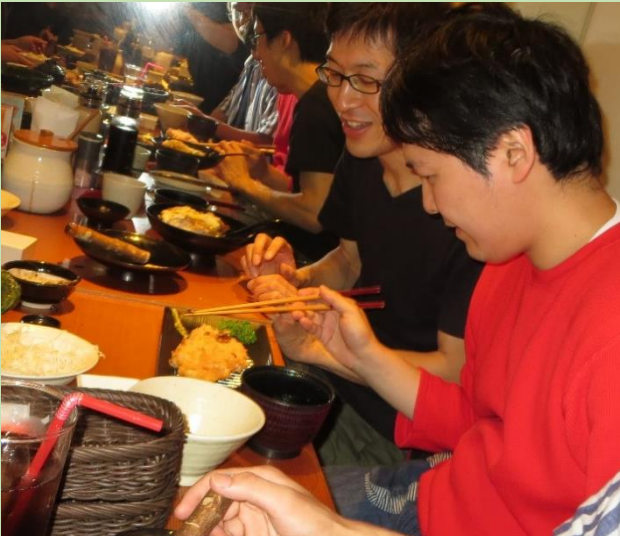
とんかつも揚げたてでサクサクです。