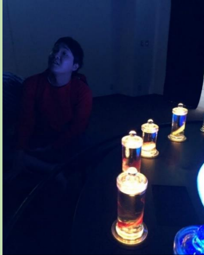
落ち着いた雰囲気です♪