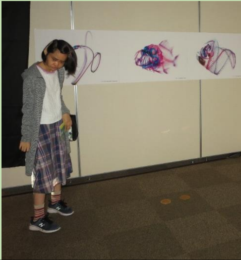
いろいろな形の標本があります！