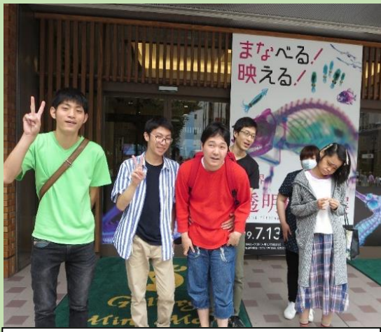
透明標本展に到着！！