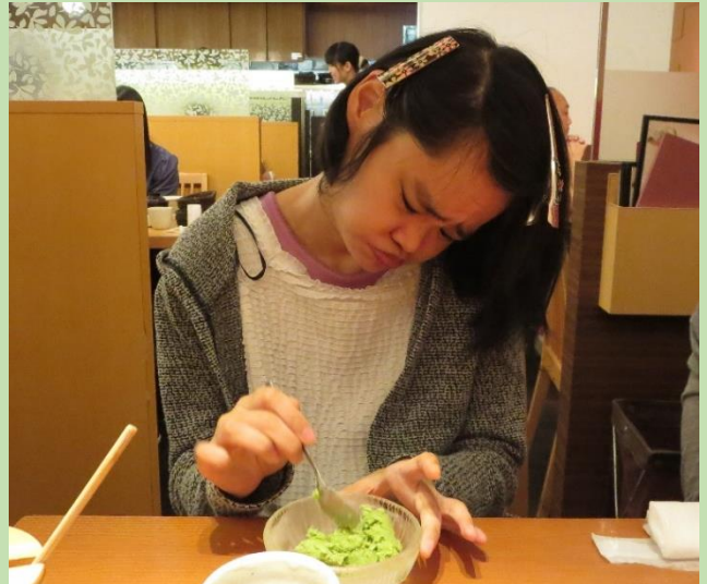
デザートもついて大満足なランチでした！