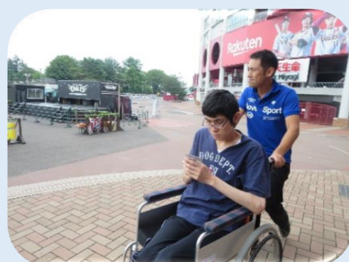
楽天 Edy も買いました。好きな選手のカードを選びました♪