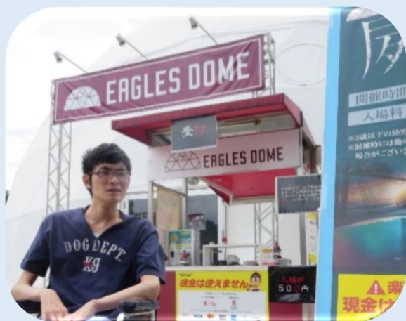
心の準備を整えて・・・ いざ、お化け屋敷へ！！