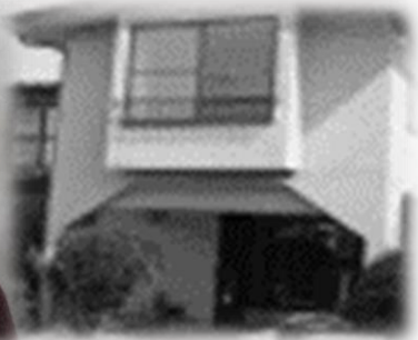
ひかりはうす チーフ世話人 菅原 森音