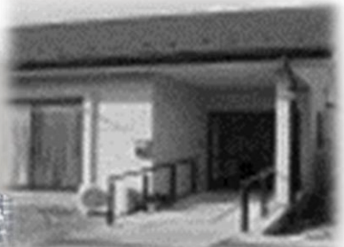
ひこうき雲 チーフ世話人 高橋 詩織