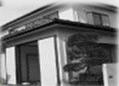
オキーノ チーフ世話人 志藤 悟