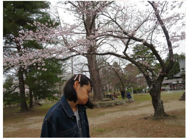
満開に咲いているね♪