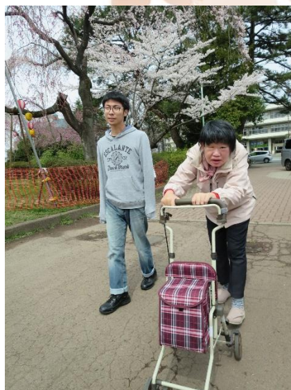
榴ヶ岡公園に到着！！