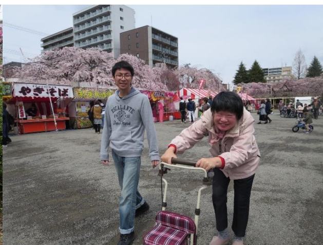
屋台もあっておいしそう😊