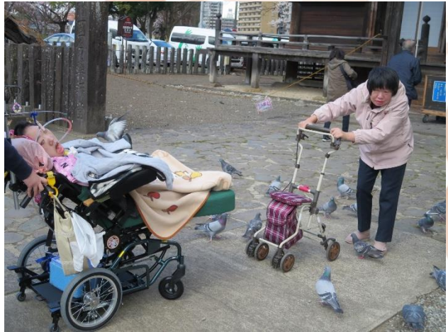
鳩がたくさん寄ってきたよ☆