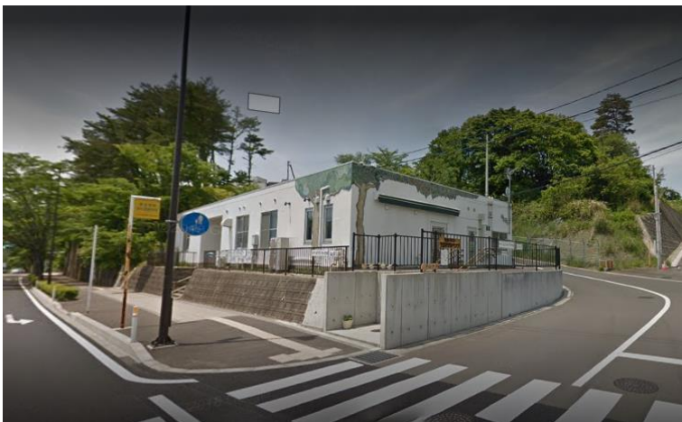
えき ちか べんり 「駅が近くて便利だわ」