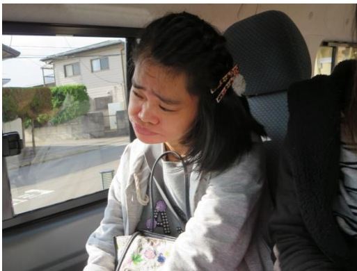
しゅっぱつ じゅんび 出発の準備ができました～

がっ にちもく やぎやま いえ がいしゅつ せいかつかいご せいかつくんれんじぎょうりようしゃ さくひんてんじ そこで、11月8日(木)に八木山つどいの家へ外出し、生活介護・生活訓練事業利用者の作品展示を ご自身でも見に行ってきました。