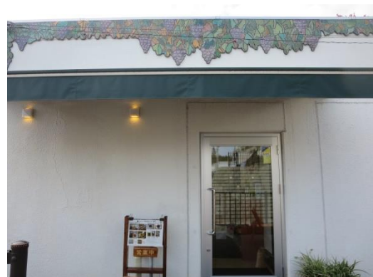
すてき てんない モザイクタイルが素敵 いざ、店内へ！