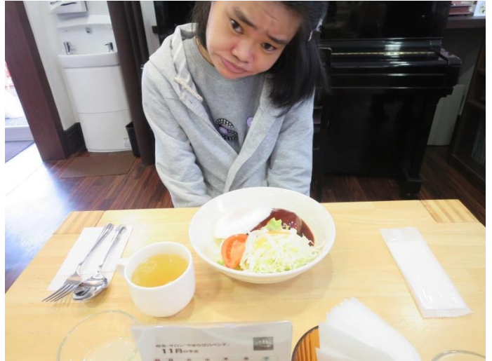
りようしゃ かた たの 利用者はランチを楽しみました