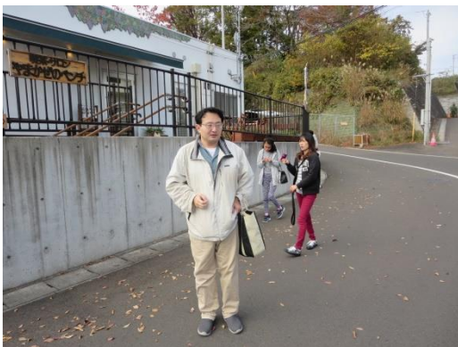
とうちゃく 「やまかぜのベンチ」に到着！