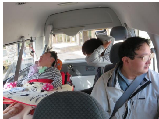
かんごし どうこう 看護師も同行しましたよ