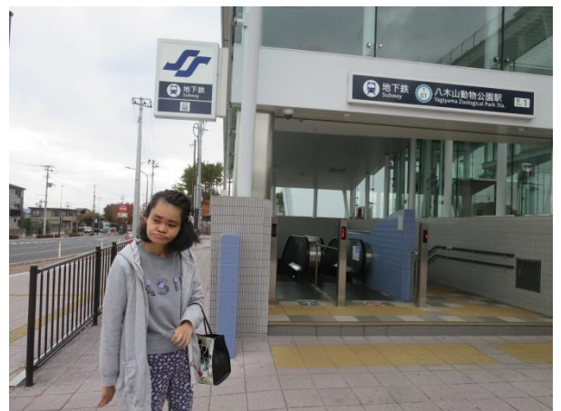
ちかてつとうざいせん やきやまどうぶつこうえんえき りよう かえ 地下鉄東西線【八木山動物公園駅】を利用して帰りました。