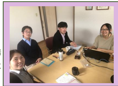
《ピボット若林》 相談支援事業