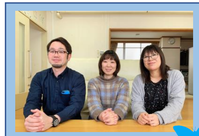
《びぼっと支倉》 相談支援事業 レスパイト事業