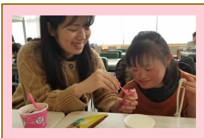
《つどいの家・アプリ》 生活介護事業