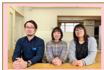
《びぼっと支倉》 相談支援事業 レスパイト事業