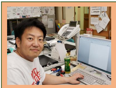
《つどいの家・コペル》 生活介護事業