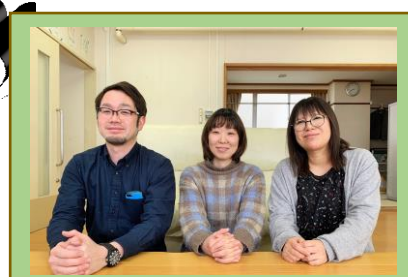
《ぴぼっと支倉》 相談支援事業