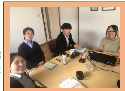
《ピボット若林》 相談支援事業