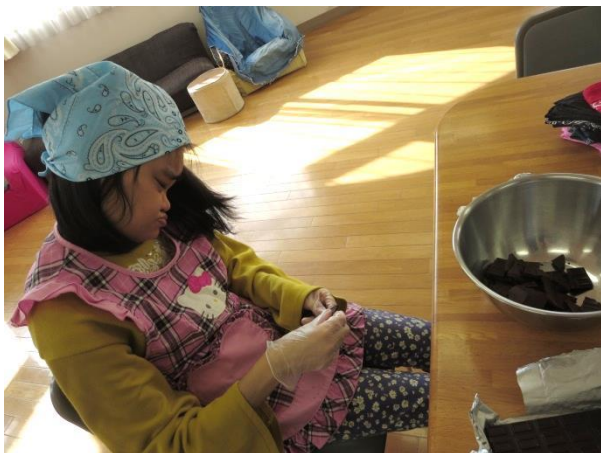
チョコレートを手で割っています