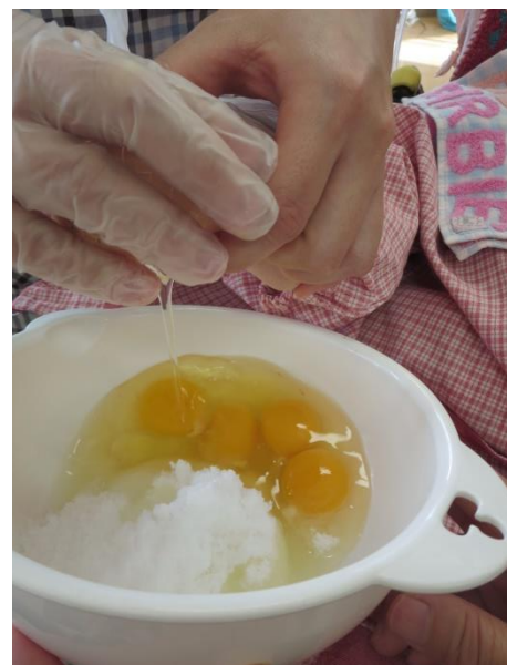
パカッ♪ じょうす わ 上手に割れました！