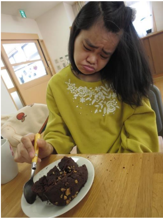
おいしいっ！ ペロリと完食 かんしょく ♡