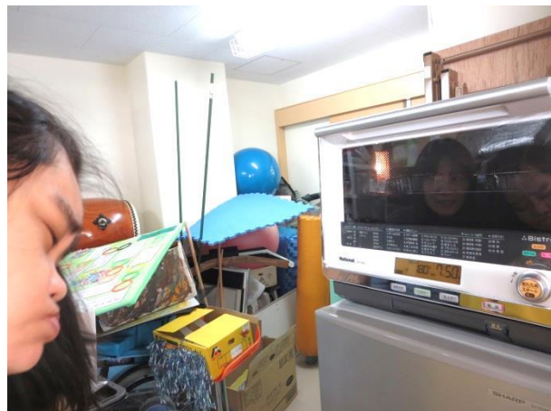
オーブンのスイッチを押しました