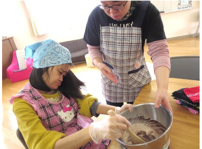
よ〜く かき混ぜています