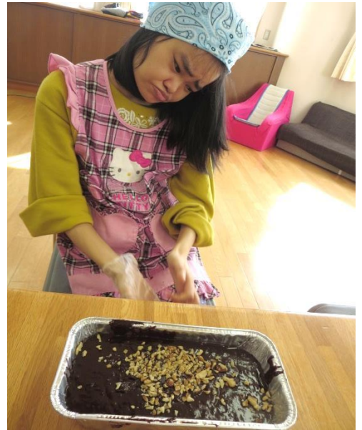
こんな感じにできました☆彡