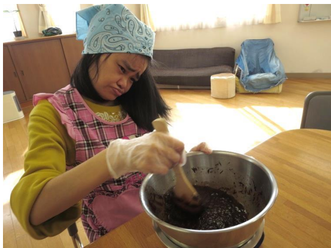
バターも入れて、よく混ぜ合わせます