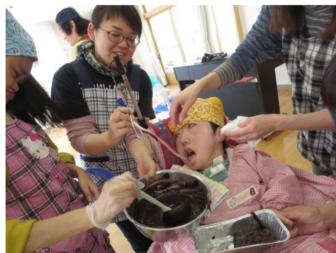
こなるい あ 粉類も合わせたチョコレート液を型に流します