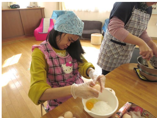
たまご と 砂糖 を 合わせています