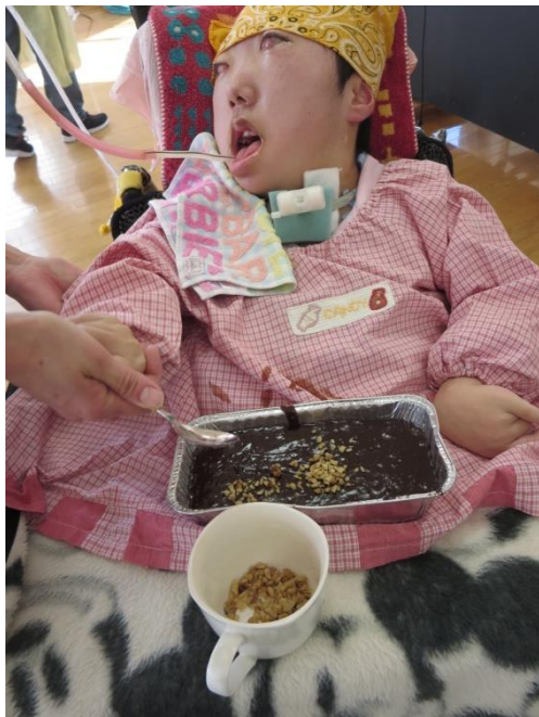
スプーンでナッツをすくい、パラパラパラ〜♪