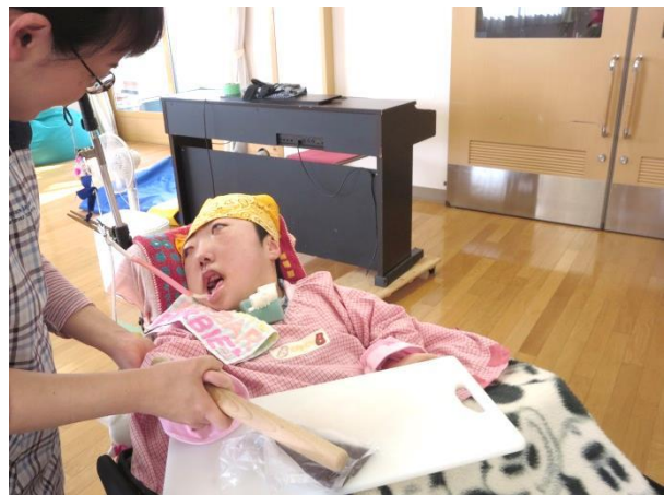
ふくろ い 袋に入れたチョコレートを麺棒で割りました