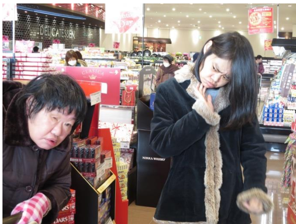
じぜん わたしたち ざいりょう か た 事前に私達が材料の買い出しをしました