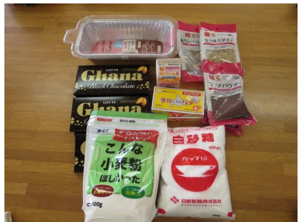
ざいりょう ようい こんな材料を用意しました