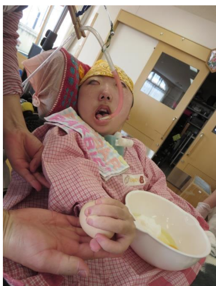
なまたまご の かんしょく を かくにん する ため に ぎ 握り