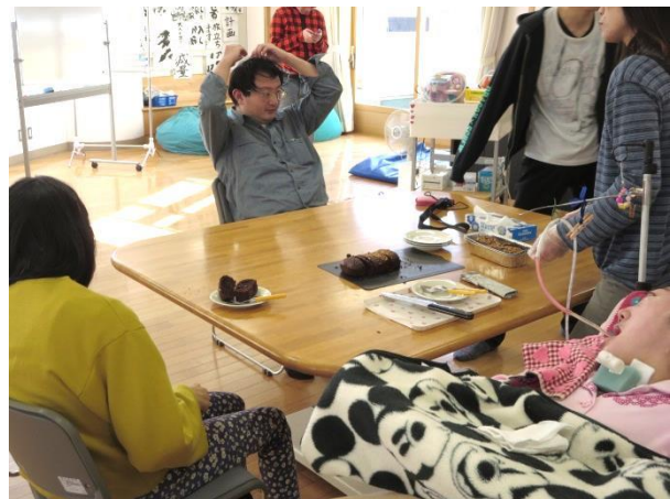
★午後の活動 茶話会をしましょう★