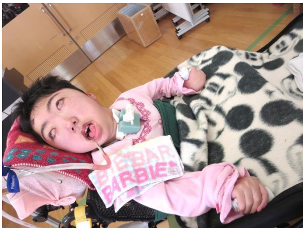
エプロンと三角巾を取ると「ホッ♪」