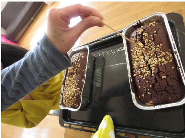
生地が膨らんでる♪→竹串を刺して焼き上がりを確認