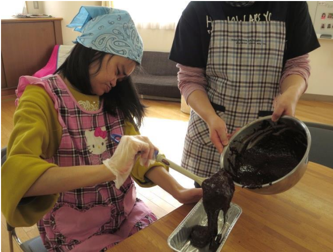
たまにお玉にタツプリ すくい取って型へ!