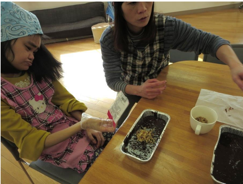
ナッツをパラパラ〜♪