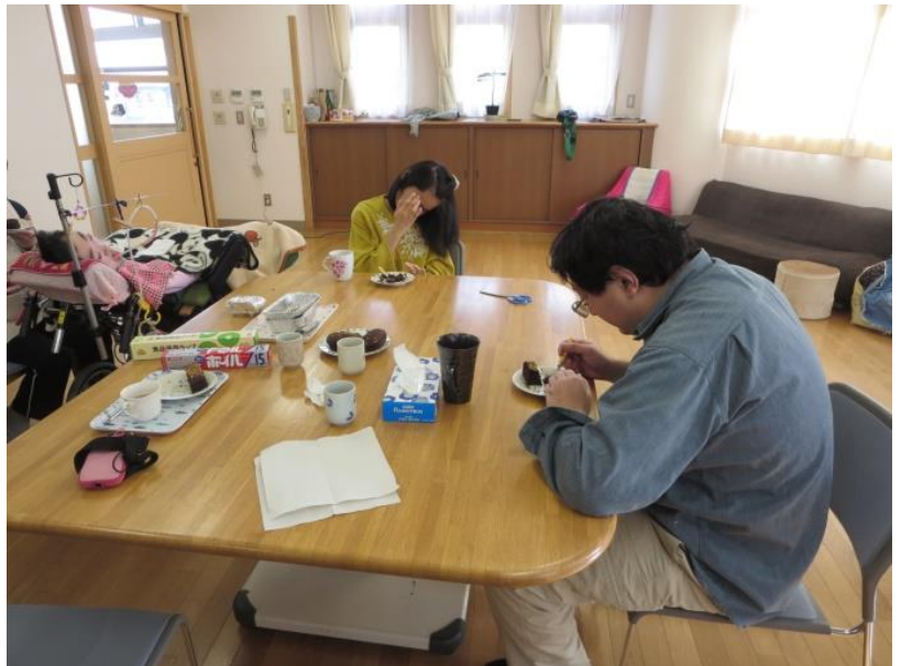
その後、職員も一緒に美味しく頂きました☆ ご しょくいん いっしょ おい いただ