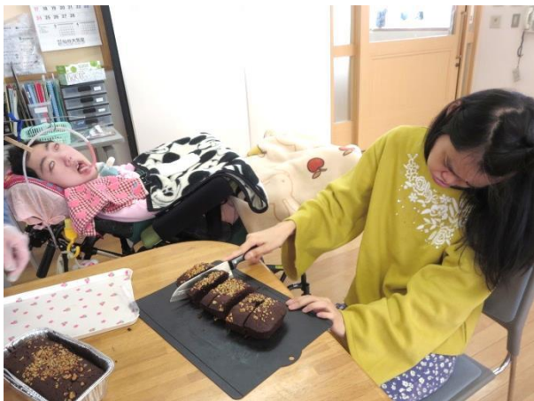
皆さんの分もドンドン切り分けました