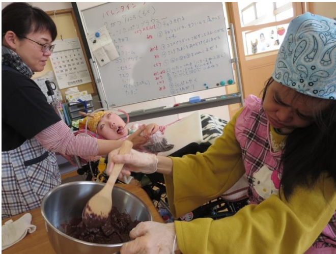
わたし わ の割ったチョコレートも湯せんして下さい