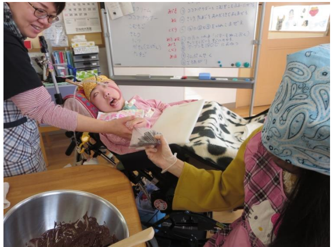
う 受け取ったわよ〜♪