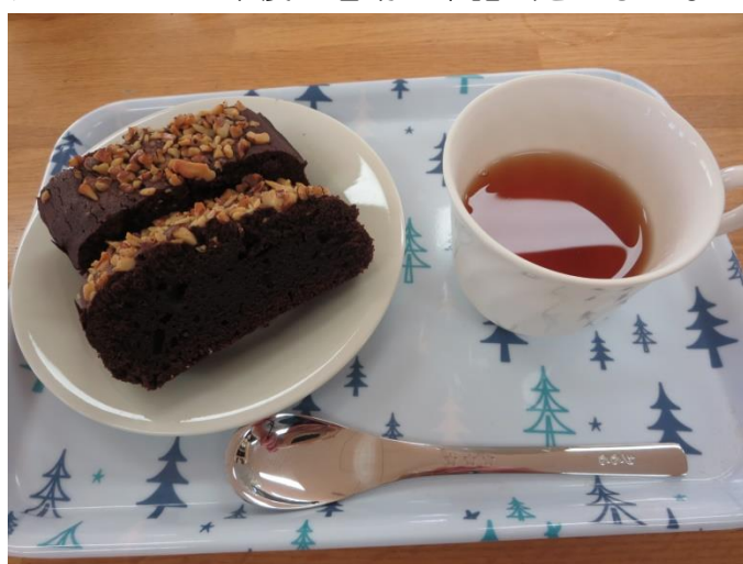
仕上がりを確認し、私の分は入浴支援員へ贈る事に決めました（声掛けで穏やかな表情）