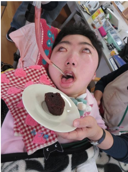
入浴支援員に喜んでもらえました♡ にゅうよくしえんいん よろこ