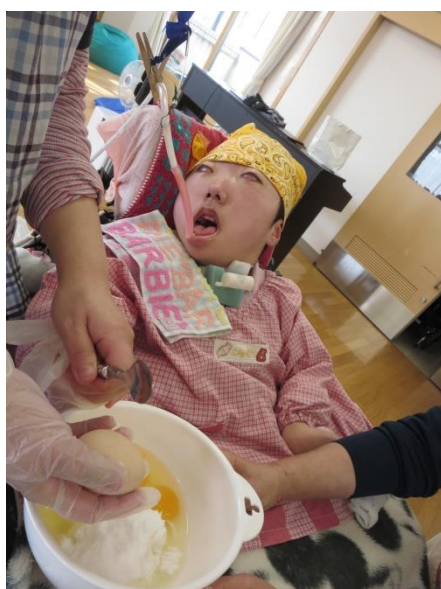
スプーンでコンコン♪