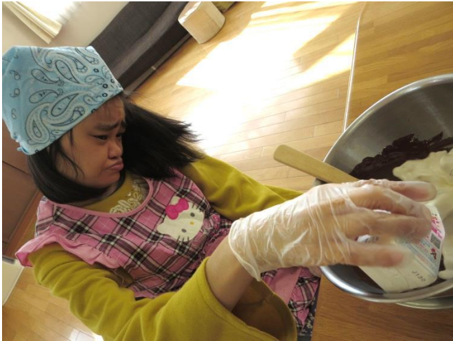
なま 生クリームを投入！ とうにゅう