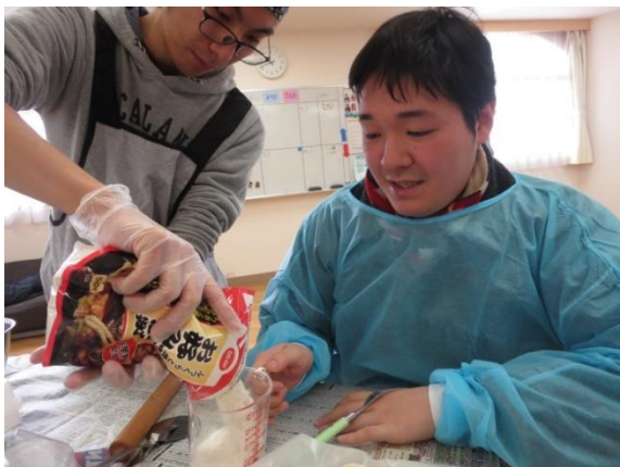
【粉類は、袋の上から何度も触って感 かん 触 じよく の確認 かくにん 。 こなるい らくろ なんと さわ