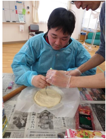
【生地を伸ばしてフォークで穴をあけ】