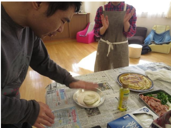
【自分の昼食を作りましょう♪】