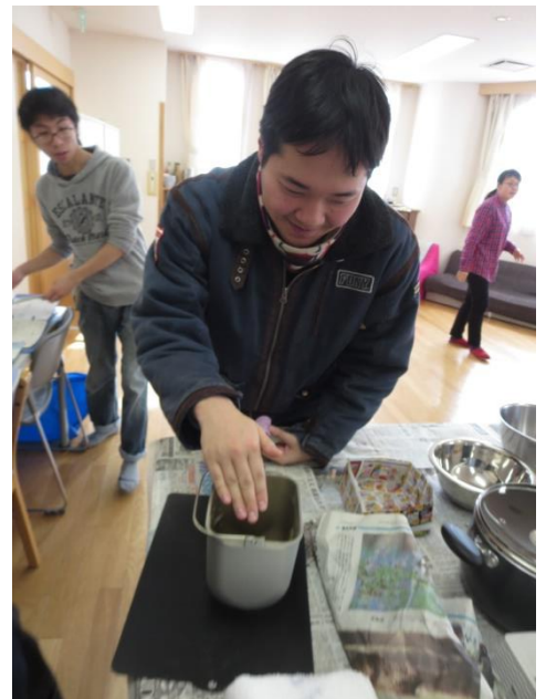
【ピザ生地ができあがりしました♪ あたた 温かくて、ふわっふわ! ふわっふわに引き付けられて】