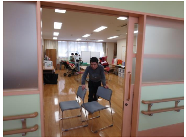
【イス運び はこ びは得意 とく なので任せ まか せて下さい】