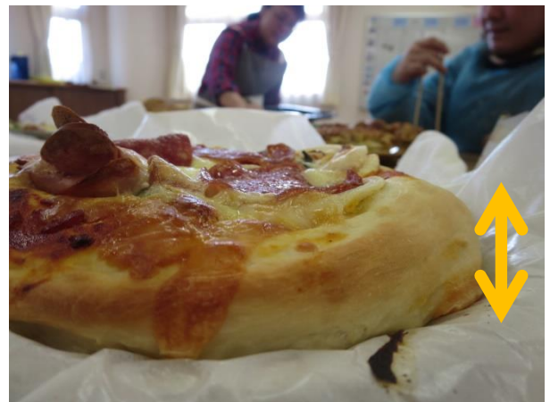
【厚みがあって、しっかりとしたピザ】