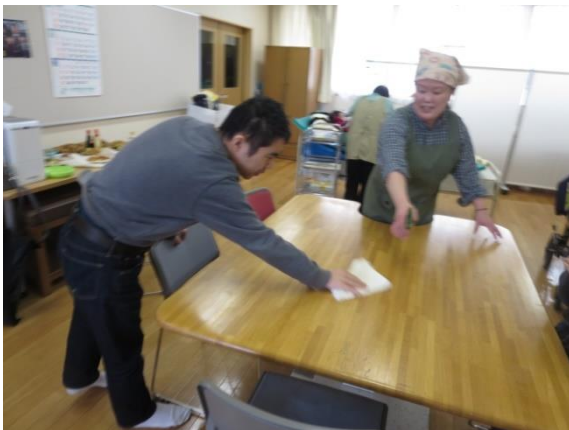
【テーブル拭 ふ きをお願いしま〜す】