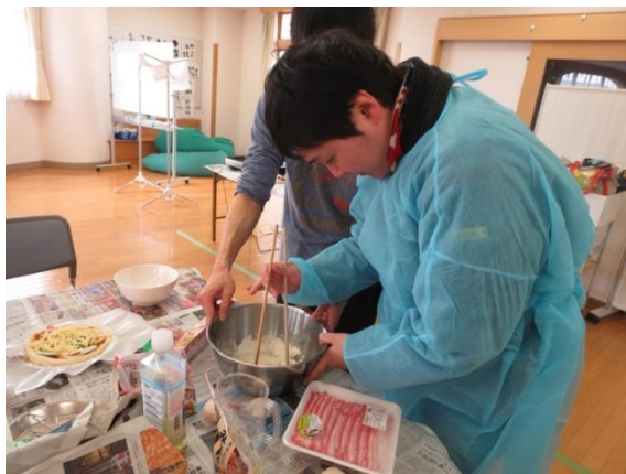
【計 けいりよう 量 りよう して水 みず と混 ま ぜ合 あ わせています】