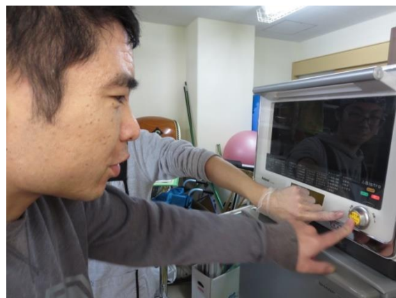
【ピッ♪ 次 つぎ 々 つぎ とピザ や を焼 あ き上 あ げます】