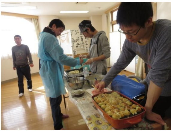
【焼き場は盛り上がってきました☆】