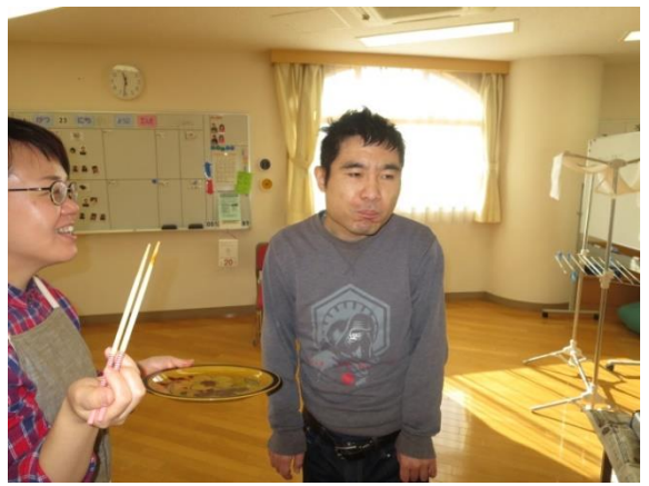
【たこ焼きの試食をしました】