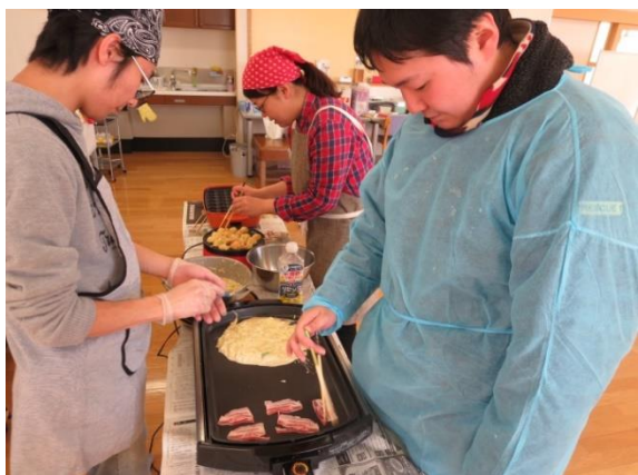
【お好 この み焼 や きのお肉 にく を丁 てい 寧 ねい に焼 や いています】