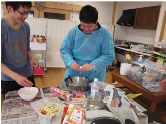
【コンコン・パカッ♪ 慣 な れた手 て つ つぎ きで次 な 々 また と生 わ 卵 たまご を割 わ り、生 き 地 じ を滑 な め な かに混 ま ぜています】