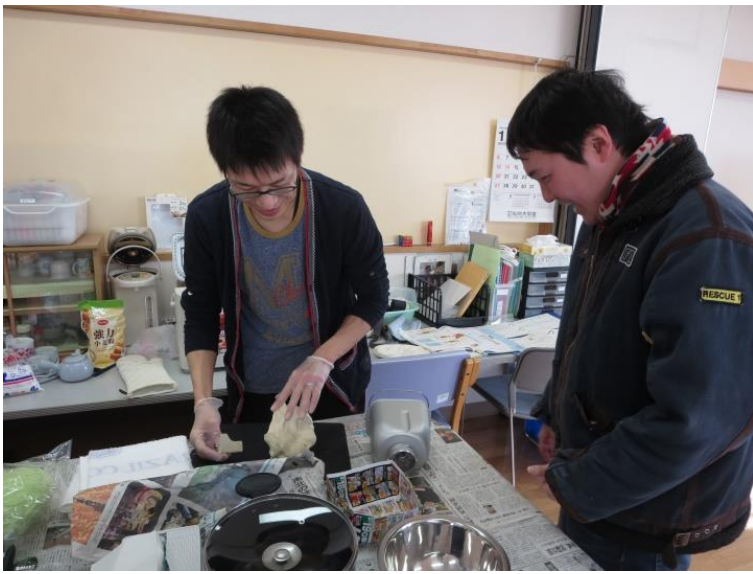
【ピザ生地に興味津々。さあ、エプロンをしましょう☆】