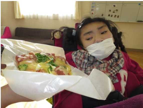
【隣室 りんしつ で面談 めんだん をしている間に、こんな あいだ にできたのね。美味 おい しそうにできましたね❖】