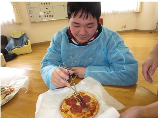
【ピザカッターで切り分けました】