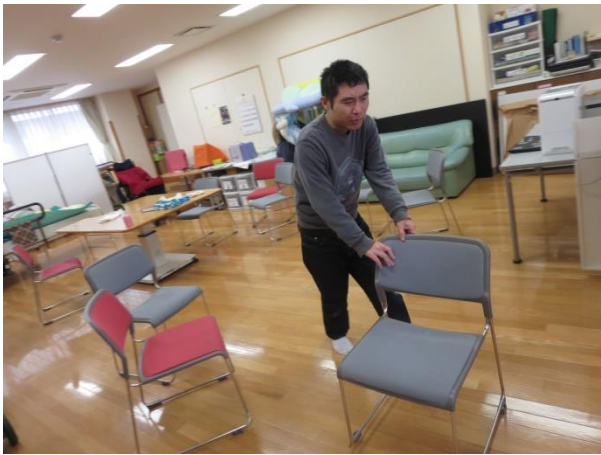
【食べた た ら、皆 みんな で後片付け あとかたづ をしないとね】