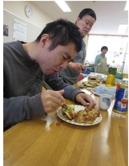
【美味 おい しい！あつという間に完食 い ま かんじやく 】