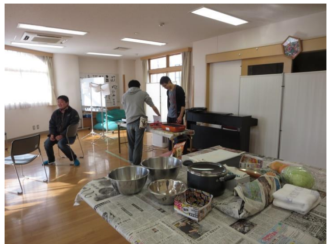
あさ かい きょう こなもん 朝の会「今日は粉物パーティー イエーイ！」【テーブルを新聞紙でカバーし、ヤル気みなぎる!】