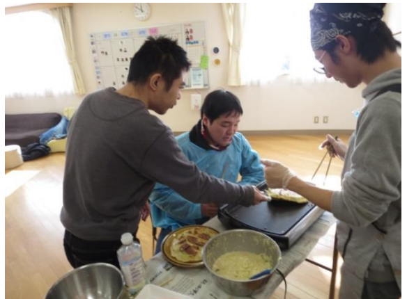
【フライ返してポン♪ 成功しました!】