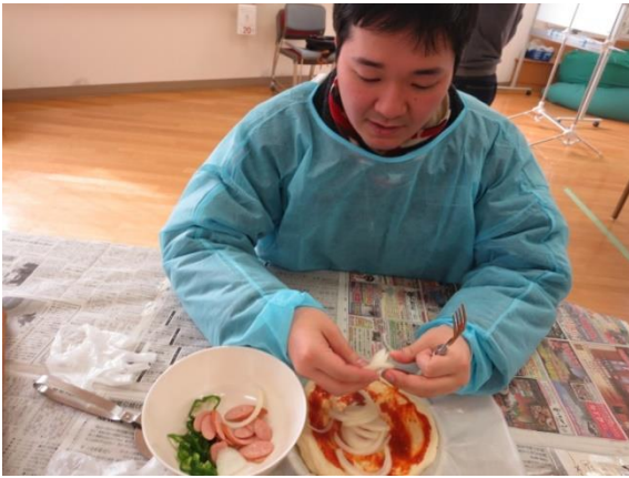
【ピザソースを塗り、具はタマネギ・ピーマン・ウィンナー 仕上げにチーズをトッピング】