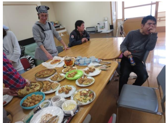
【取りわけるので、お待 まち ち下さーい】