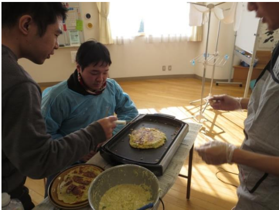
【焦げちゃうのでひっくり返してください】