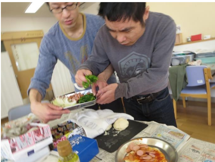
【ピーマンは多めにトッピングしました】