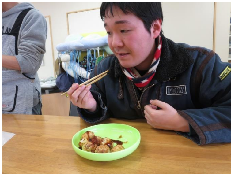
【いつもと違 ちが う雰囲気 ふんいき なので、少し すこ 慎重 しんちょう 】