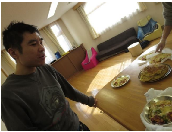
【やっぱり自分 じぶん が作ると美味 おい しそう♪】