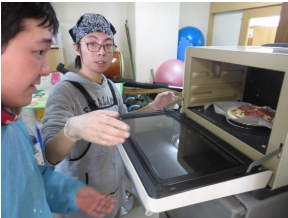
【オーブンレンジに入れて、仕上がりを待ちます】