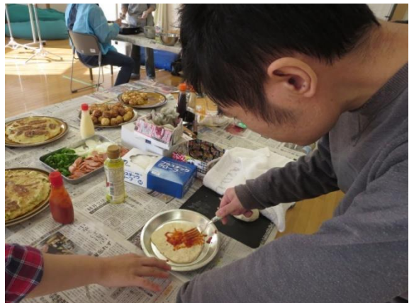
【美味くな〜れ、美味くな〜れ】