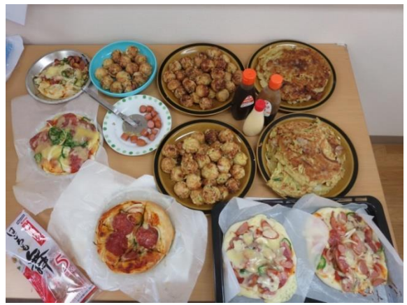
【このボリューム…でも、まだまだ焼 や いています】