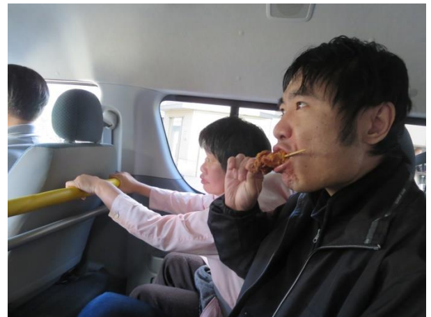
も かえ から あ 持ち帰った唐揚げを車内で「いただきます」