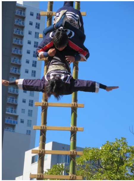
からだ はな はしごから体が離れると、