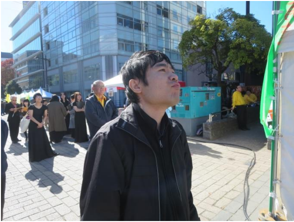
おも 思わず見入ってしまう