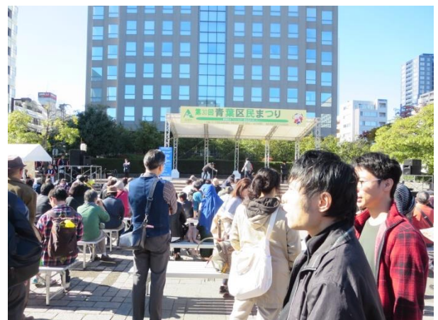
どこから行こうかな～