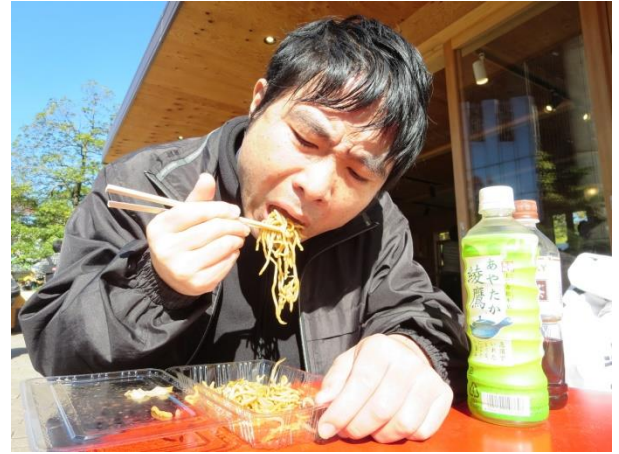
てみせ や 出店で焼きそばを買って食べたよ