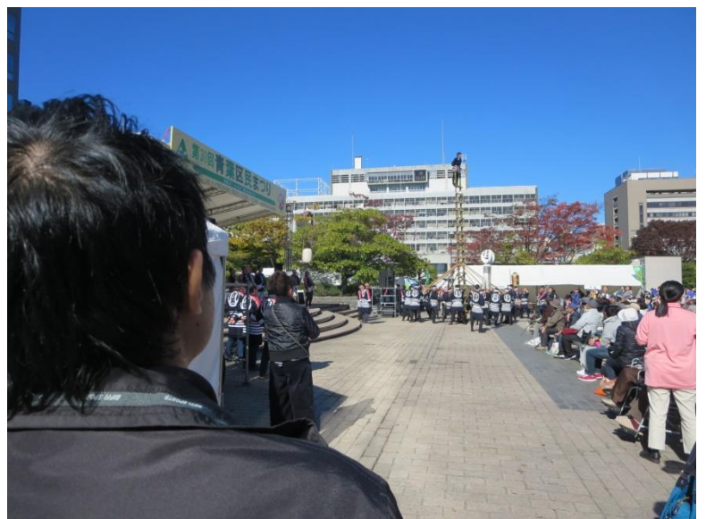
偶然、 だんせいはん 男性班もステージ はっぴょう 発表 み を見ていました。