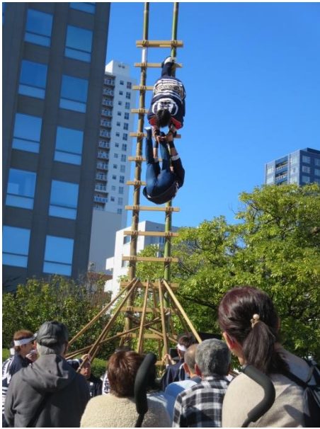
ふたりぐみ はくりよく 2人組は迫りも