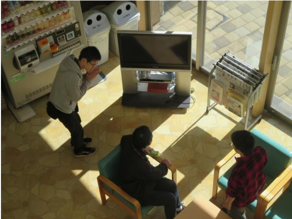
あおばくみん かもの 青葉区民まつりで、お買い物ができますよ!

仙台いしわかばやししょうがいしゃふくし せいかつかいこ わかばやしくみん にちようび 仙台市若林障害者福祉センターの生活介護は、若林区民ふるさとまつりが日曜日と かさ かつどう ざんねん い がつ にち ど 重なり、活動としては残念ながら行くことができませんでしたので、11月3日（土）に あきば なか こうとうだいこうえんしみんひろば かいさい だい かいあおばくみん でか 秋晴れの中 勾当台公園市民広場で開催された、第30回青葉区民まつりに出掛けました。 くせいしこう ねん こと あおばく つこ だいせいぎょう 区制施行30年との事で『青葉区の“いいもの”詰め込みました!』と大盛況でした。 あき あおばく まんきつ おい たもの たの てんじ 『秋の青葉区を満喫しよう!』と、美味しそうな食べ物や楽しそうな展示がありましたよ。 ステージパフォーマンスもあり、どこを見ても賑わう人でいっぱいでした!