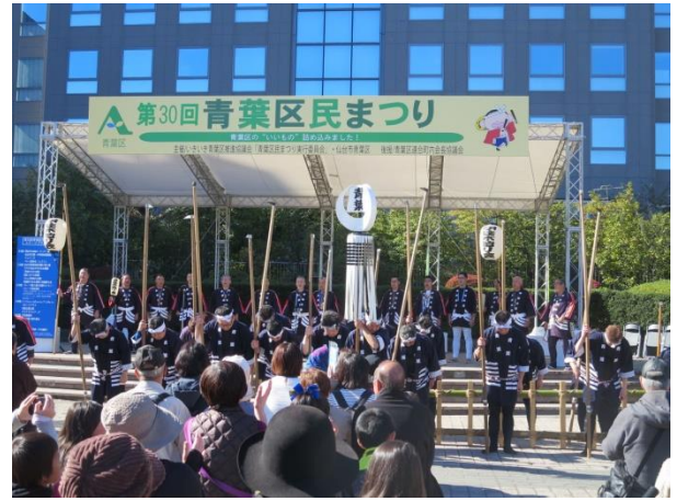
やっぱりステージが き 気になるな