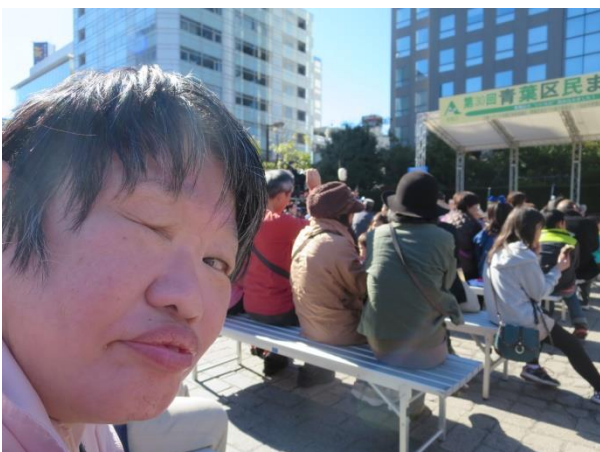
わたし はっぴょう み 私はステージ発表が見たいの