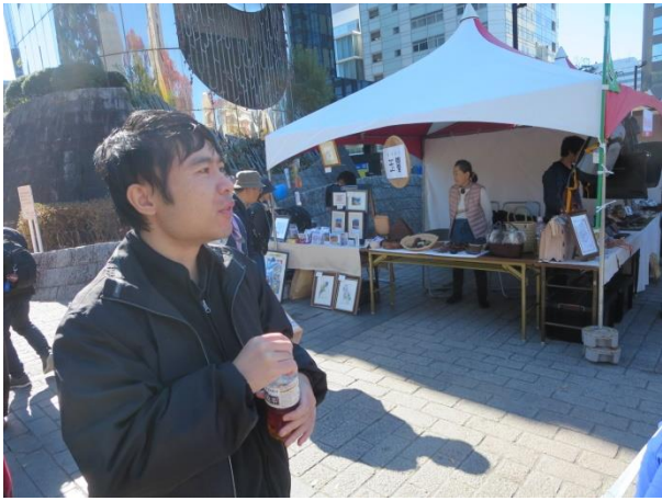
まずはお茶を ちゃ 一本 ほんこうにゆう 購入して♪