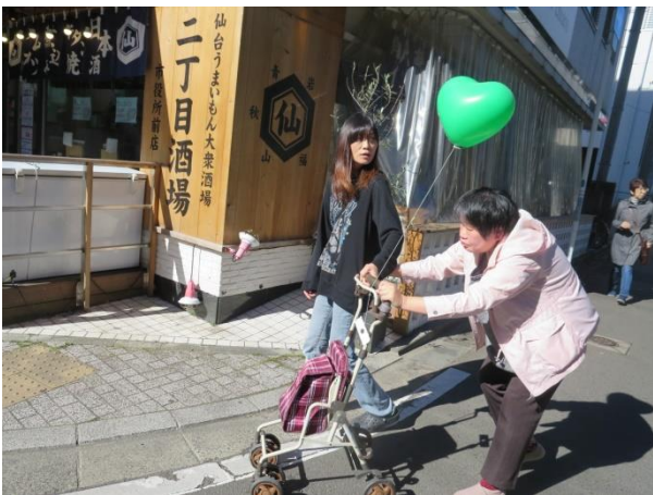
ま あ ぼしよ いどう 待ち合わせ場所へ移動していまーす