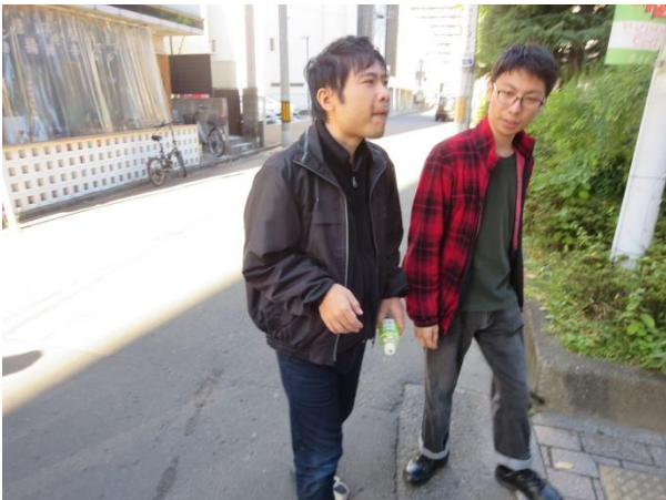
だんせいばん じょせいばん わ たが い ところ へ 男性班と女性班に分かれ、お互いの行きたい所へ向かっていますよ