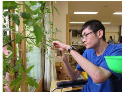
【バラタ菜園で、薬味等に使う野菜を収穫しましたよ】