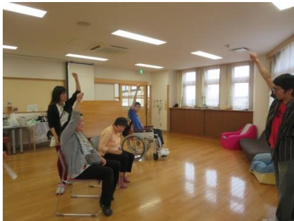
【うどん打ち イエー!】

食事に配慮の必要な利用者さんがいらっしやっただので、職員間で相談しながら、事前に 栄養士や看護師と話し合いを行って準備していました。