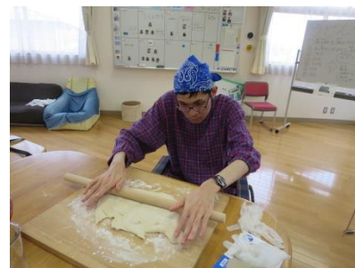
【 し ょく いん が き じ の を の ば し て い る よ う す を み て い た だ い て か ら → き ょう り き こ の の ば す の が た い へ ん な ん だ な 】