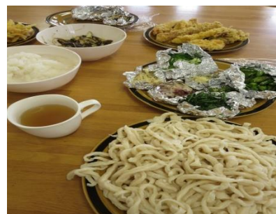
【 やさ い やく み で ヘル シー 。無 む え ん のダ し 汁 じ でツ る ツ る 〜♪】 【 みな さん で 美 おい しく た べ ま した よ ♡】