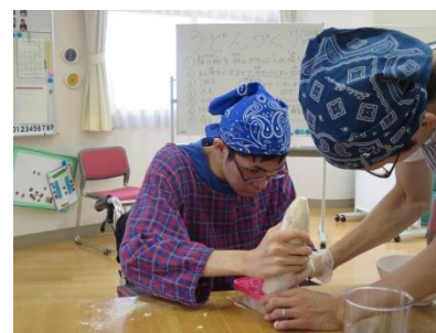
【 め ん ぼう の の ば し 、 き か た は み ほん を み な が ら ち ょ ん ち ょ ん ♪】 【 やさ しく だい こん を お ろ して から 辛 み ナシ】