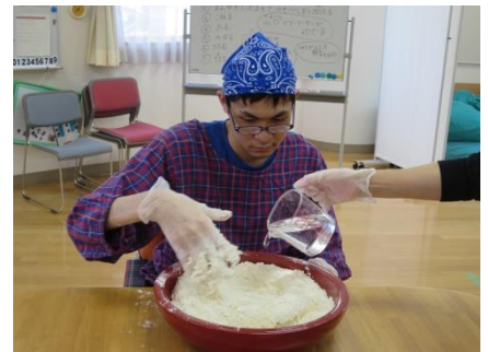
【強力粉に水を投入】