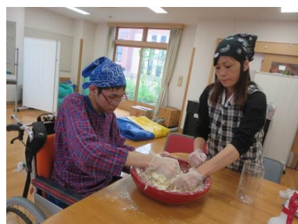
【職員と力を合わせて、生地をまとめています】