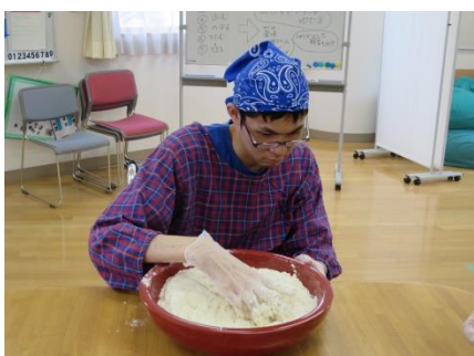
【粉に水を行きわたらせます】