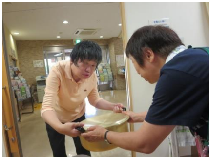
【大鍋を貸して下さい】