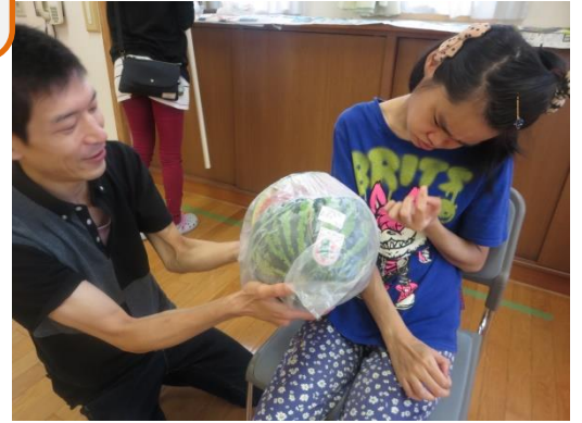
「割れましたよ」 チラッ