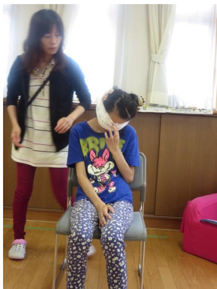
「少し怖いかも…チラッ」