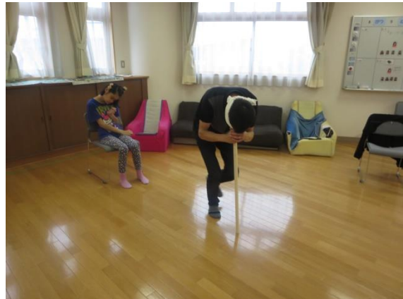
「ぐるぐるバットやってからね♪」