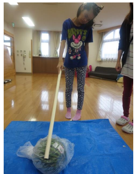
2回戦は目隠しなしでポンポン♪