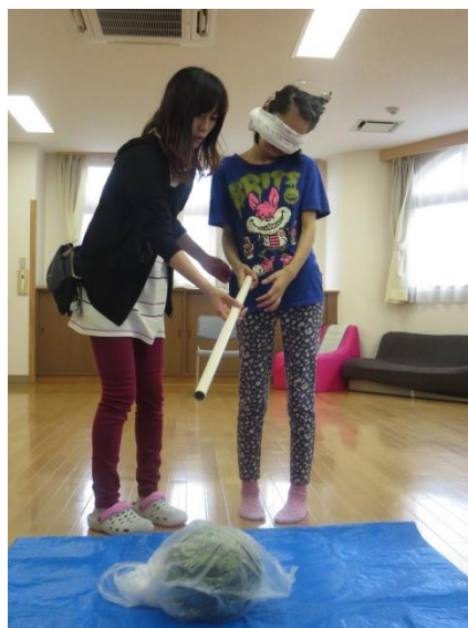
「ここですよ」 ポンポン♪