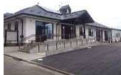
ぴぼっと南光台 (ヘルプ・レスパイト事業)