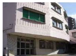
ぴぼっと支倉 (相談・レスパイト事業)