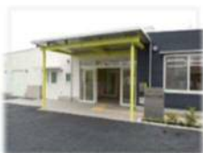
仙台つどいの家 (生活介護事業)