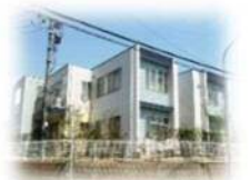
つどいの家・アプリ (生活介護事業)