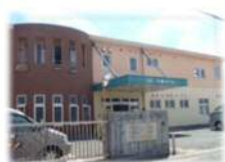
つどいの家・コペル (生活介護事業)