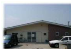
ピポット若林 (相談・ヘルプ・レスパイト事業)